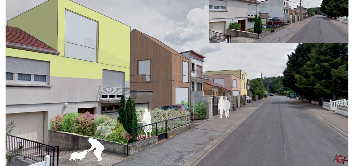
Quartier de Haute-Yutz : Etat projeté - Renouvellement du tissu urbain