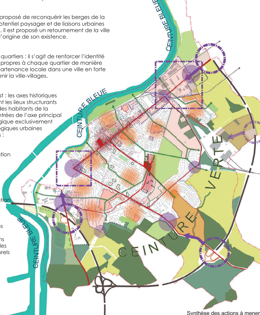
Synthèse des actions à mener