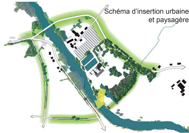
Schéma d'insertion urbaine et paysagère

composantes du programmes au lieu de ces lisières qu'elles contribuent à recréer avec leur aménagement paysager et une gestion intégrée des EP. Les programmes couverts, regroupés autour du bâtiment existant, créent une lisière bâtie à l'ouest.