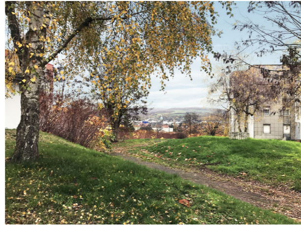
Le quartier du Beerenberg

Démolition 113 logements : 1 420 600 € HT Rénovation 168 logements : 12 020 500 € HT Résidentialisation et parc : 974 150 € HT