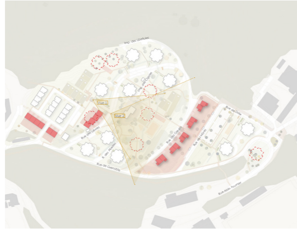
Diversification de l'offre résidentielle : démolitions et constructions

Bâti fin 1970, le quartier Beerenberg bénéficie d'un environnement remarquable. L'organisation du bâti confère au lieu urbanité dans un contexte paysager. Le quartier présente cependant une situation d'isolement malgré la relative proximité du centre.