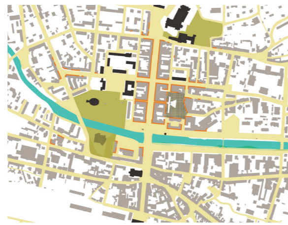
La place au sein de l'espace public