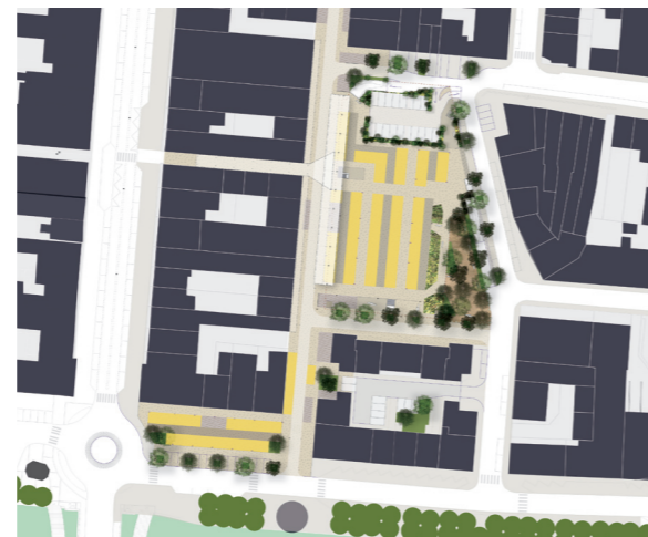
Plan masse avec implantation du marché