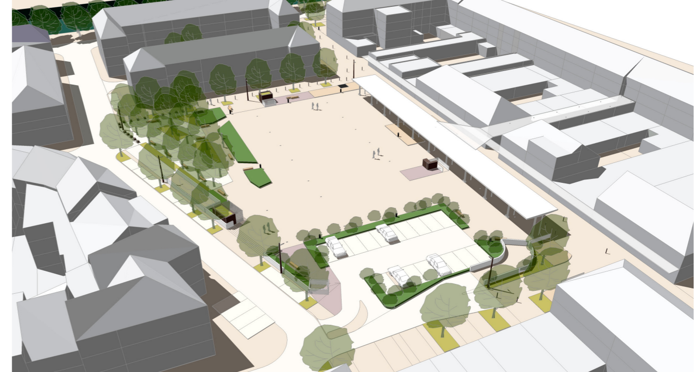
Vue aérienne sur la place depuis son angle nord-ouest