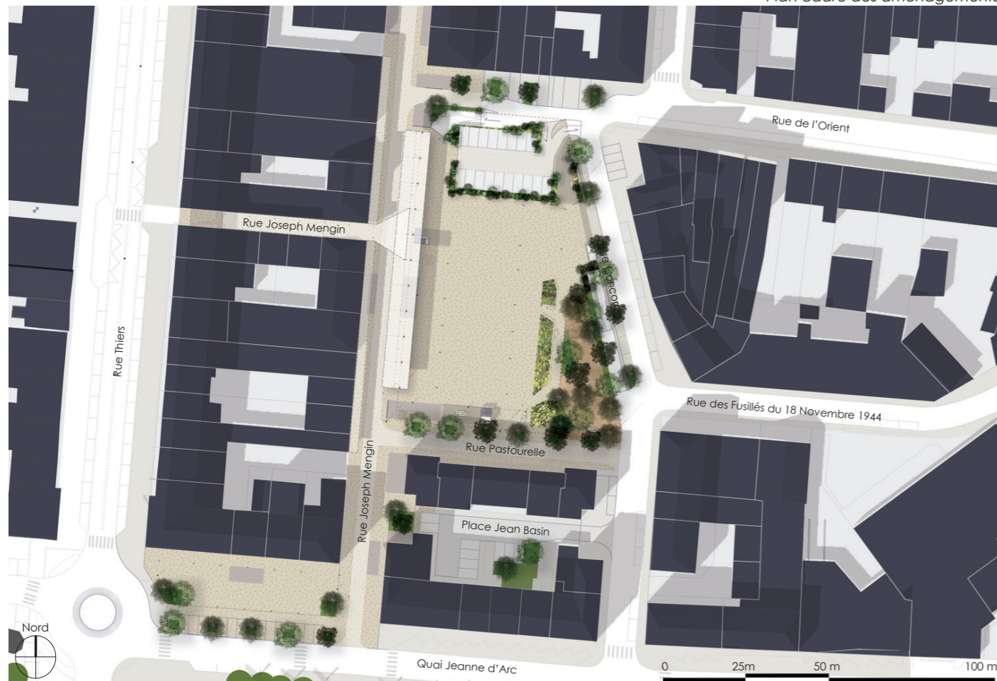
Plan cadre des aménagements

Le dessin de la place participe d'un maillage piéton liant les axes principaux de la ville à la place, l'avenue Thiers et la rue Dauphine. L'accroche sud, avec une place d'entrée de ville, place du Modular, en lien aux quais, est renforcée.