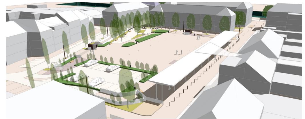
Coupe nord-sud sur une voie piétonne (détail)