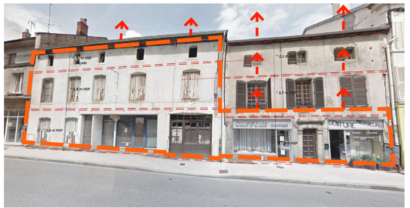
Des façades en partie conservées et rehaussées

Les logements sont tous accessibles PMR, avec cellier sur palier et un espace dédié au rangement cuisine.