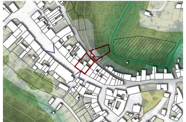
Un site en coeur de bourg et en contact de la Saône

Suite à une étude de revitalisation bourg -centre en 2021, le site est identifié comme prioritaire suite à sa position centrale dans Darney. Il se compose de deux bâtiments vacants comportant chacun une cellule commerciale et des logements à l'étage ainsi que des terrains en contre-bas arrière, rejoignant la Saône.