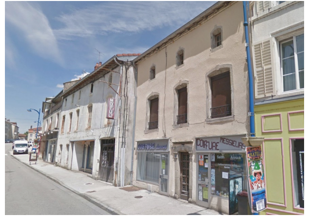
Vue du site depuis la rue de la République

Suite à une étude de revitalisation bourg -centre en 2021, le site est identifié comme prioritaire suite à sa position centrale dans Darney. Il se compose de deux bâtiments vacants comportant chacun une cellule commerciale et des logements à l'étage ainsi que des terrains en contre-bas arrière, rejoignant la Saône.