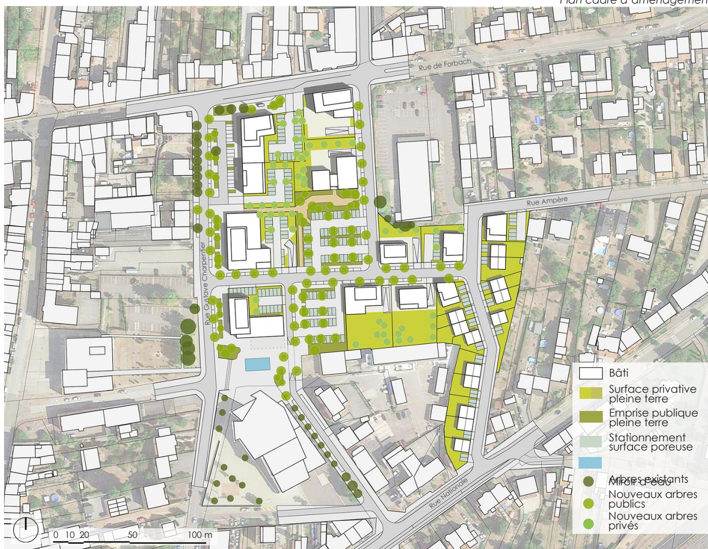
Plan cadre d'aménagement