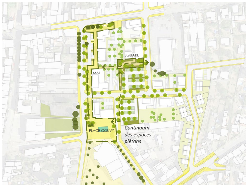
Des îlots ouverts traversés par des cheminements publics continus

Le traitement des espaces publics permet de libérer des espaces pour les piétons via l'extension de l'esplanade Gouvy, un mail piéton commercial et une sente piétonne qui joint un square en coeur d'aménagement. Le végétal et notamment la strate arborée est très fortement développée tant sur espace public que sur les emprises privées.