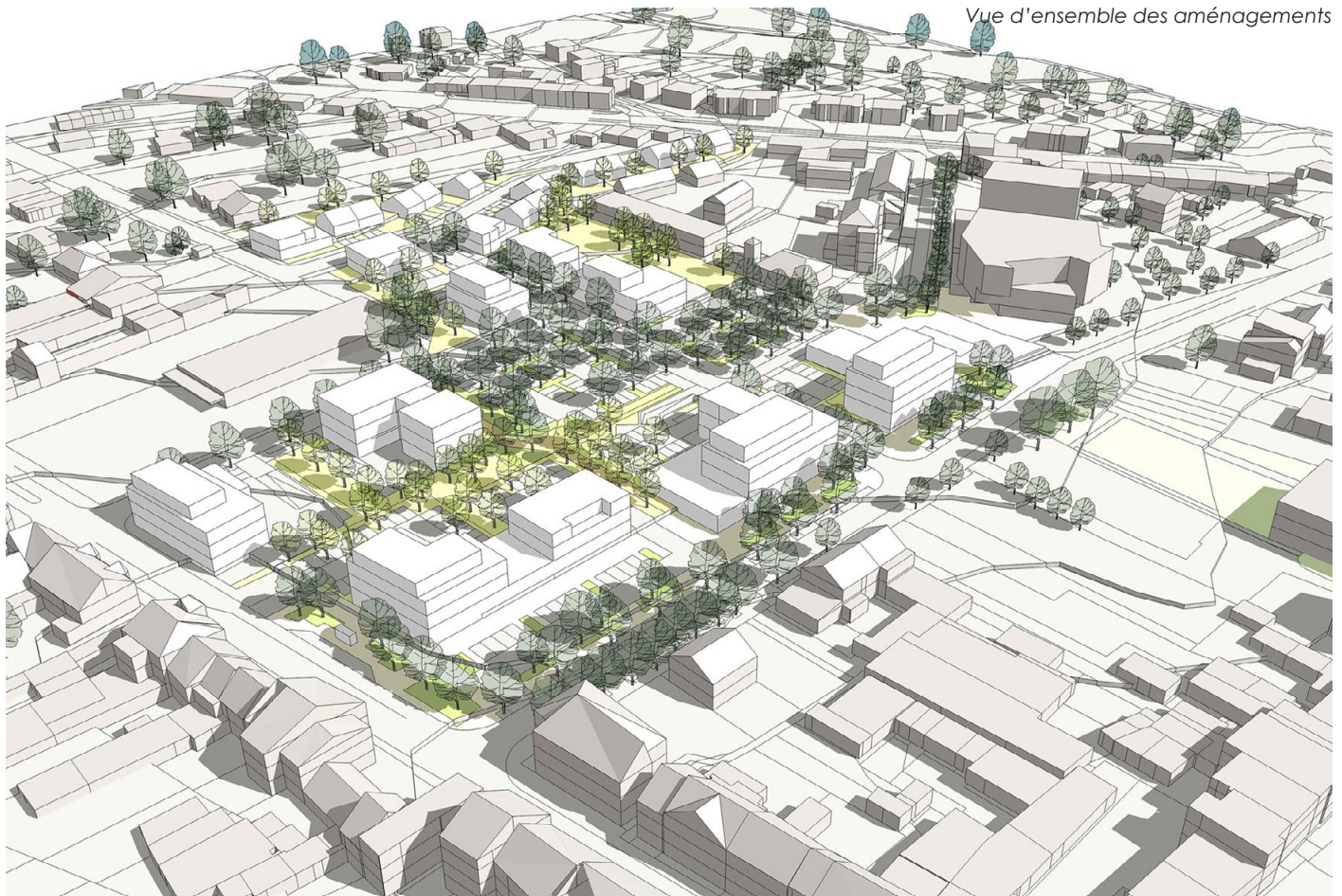
Vue d'ensemble des aménagements