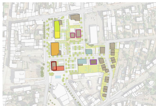
Diversité des programmes et rez-de-chaussées actifs

Le projet de mutation de ce secteur est aussi motivé par la présence de la surface commerciale des Alliés et de des cellules commerciales, fermées de longue date à l'exception d'une pharmacie.