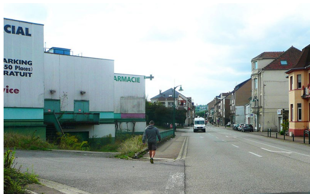
Vue du site depuis la rue de la République

Le quartier des Alliés est un secteur clé pour la revitalisation de la commune dû à son statut de porte d'entrée Est au centre-ville et des équipements présents.