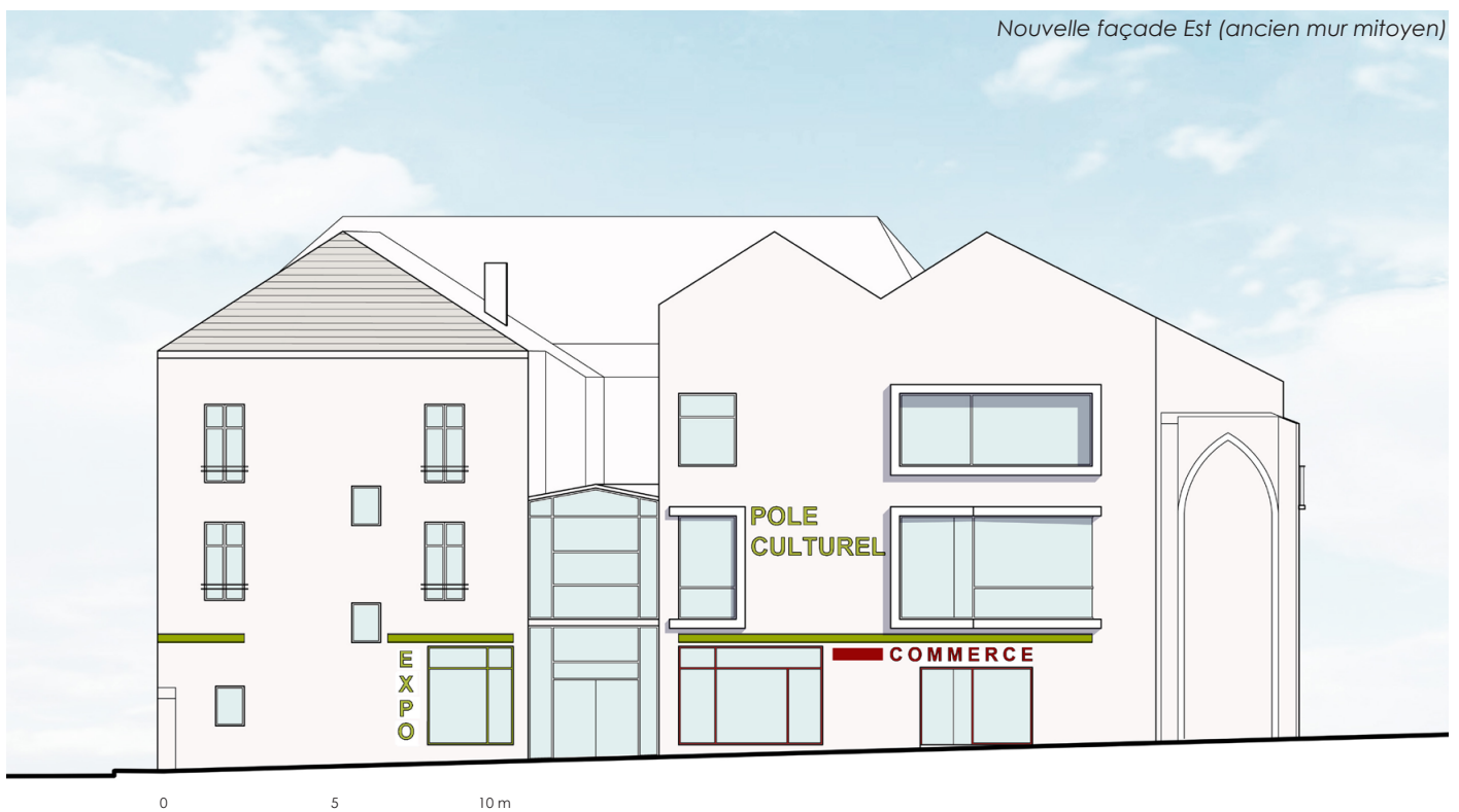
Nouvelle façade Est (ancien mur mitoyen)

L'ensemble est composé d'ERP de 4e et 5e catégorie.