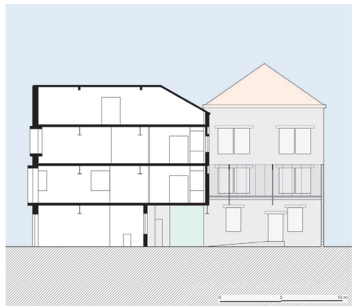
Coupe sur la rue intérieure couverte

Les différents programmes du bâtiment s'organisent autour de passages couverts en continuité des espaces publics alentours. L'organisation des lieux est tant intérieure, en lien aux passages et à la cour couverte, qu'ouverte sur l'extérieur.