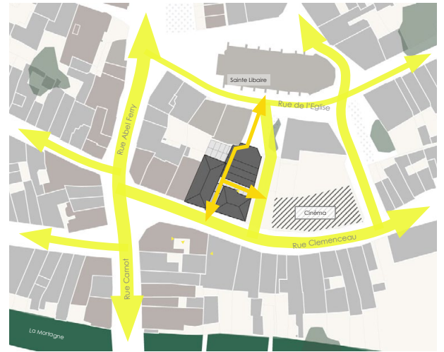
Le projet dans son contexte

Le projet comprend OTI, salle d'exposition, commerce et logements autour d'un Centre d'Interprétation (musée 'actif').