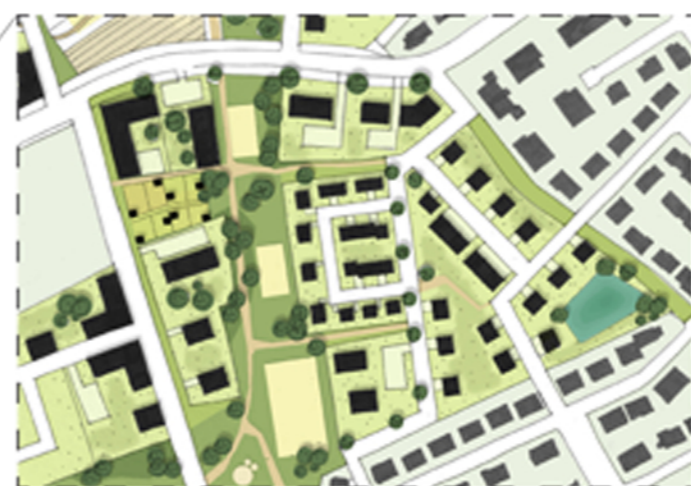
Zoom sur l'est des aménagements, un quartier jardin

En complément d'une réorganisation des tracés et stations de bus, les aménagements prévoient la possibilité d'implanter une halte ferroviaire ou un arrêt de tram-train sur les voies ferrées, en limite ouest.