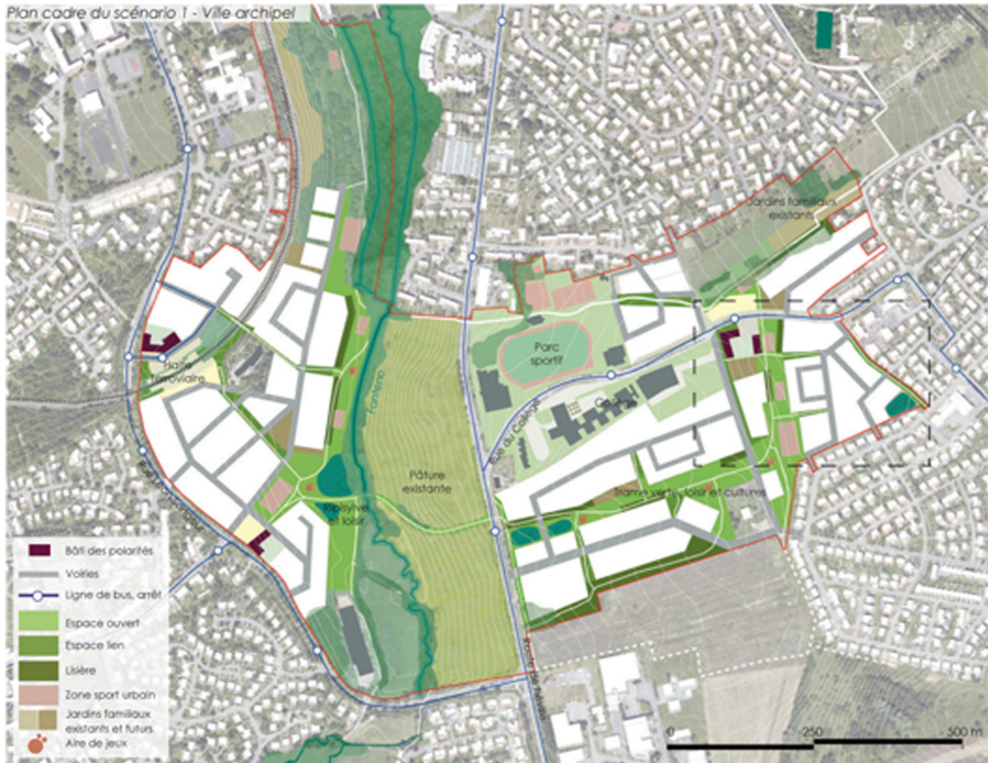
Plan cadre du scénario 1 - Ville archipel